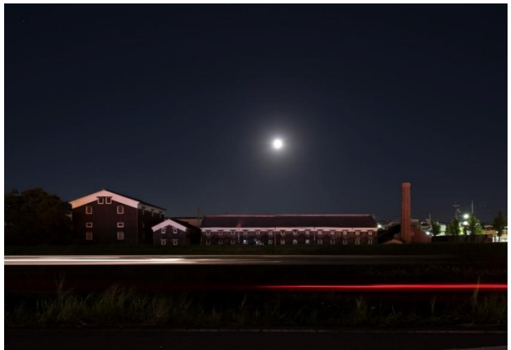
上 京都写真ビエンナーレ 2019「スーパームーンの夜」