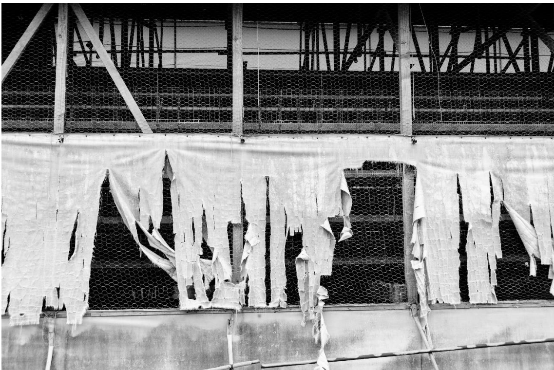
野鳥の侵入を防止する金網と鶏舎内の温度を調節するカーテン