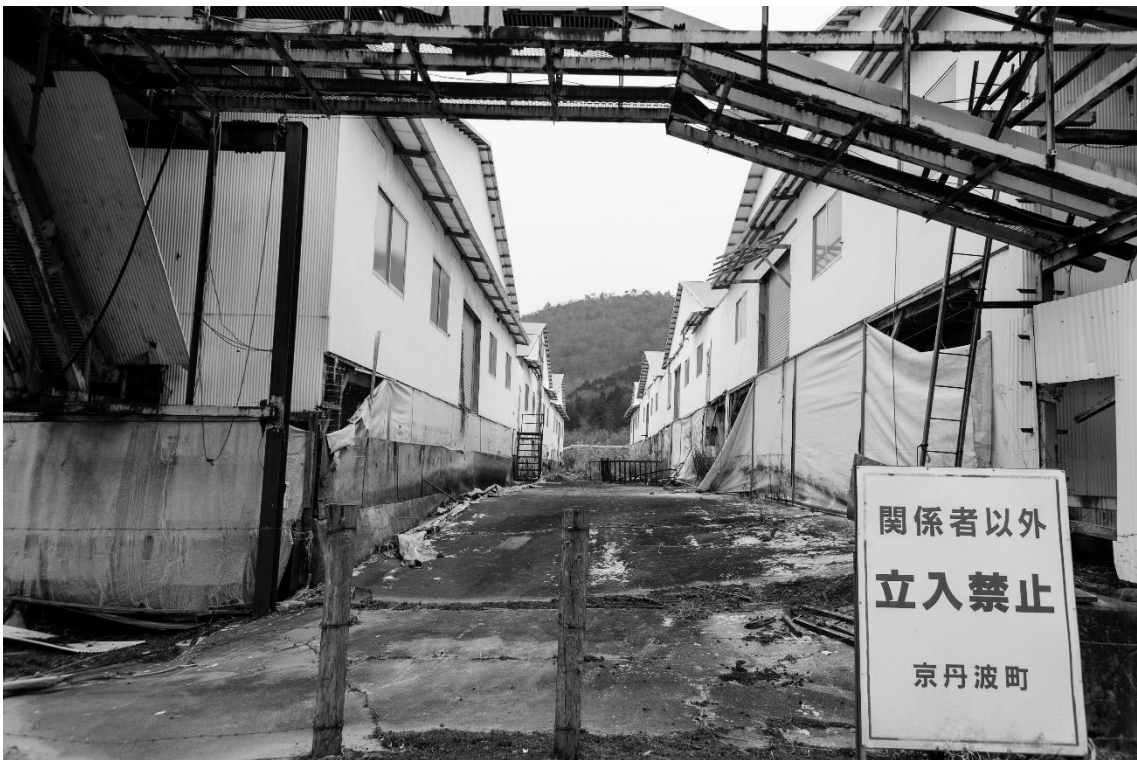
養鶏場敷地内を町道から撮影