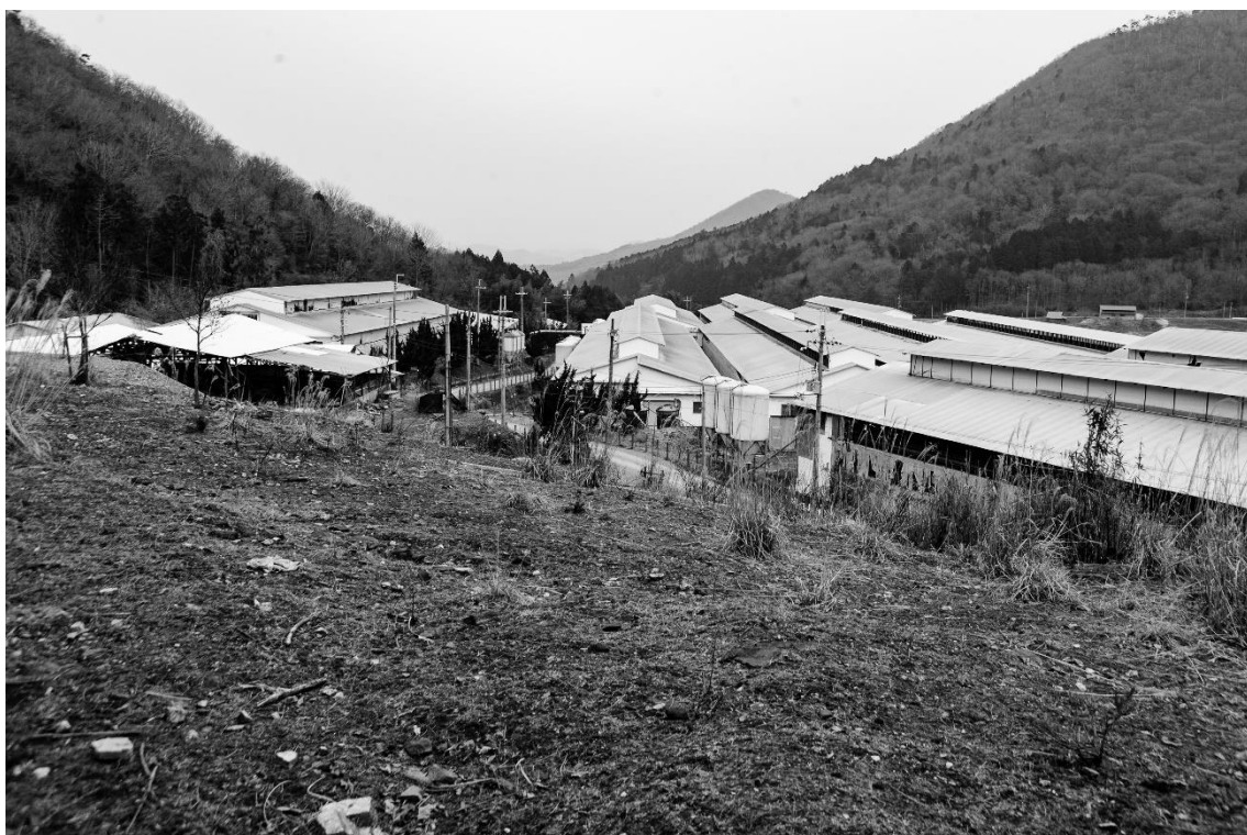
埋却跡地から鶏舎群を望む