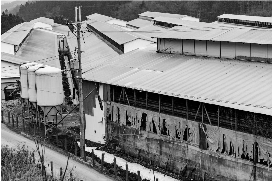
1 鶏舎に採卵鶏が 25,000 羽収容されていた