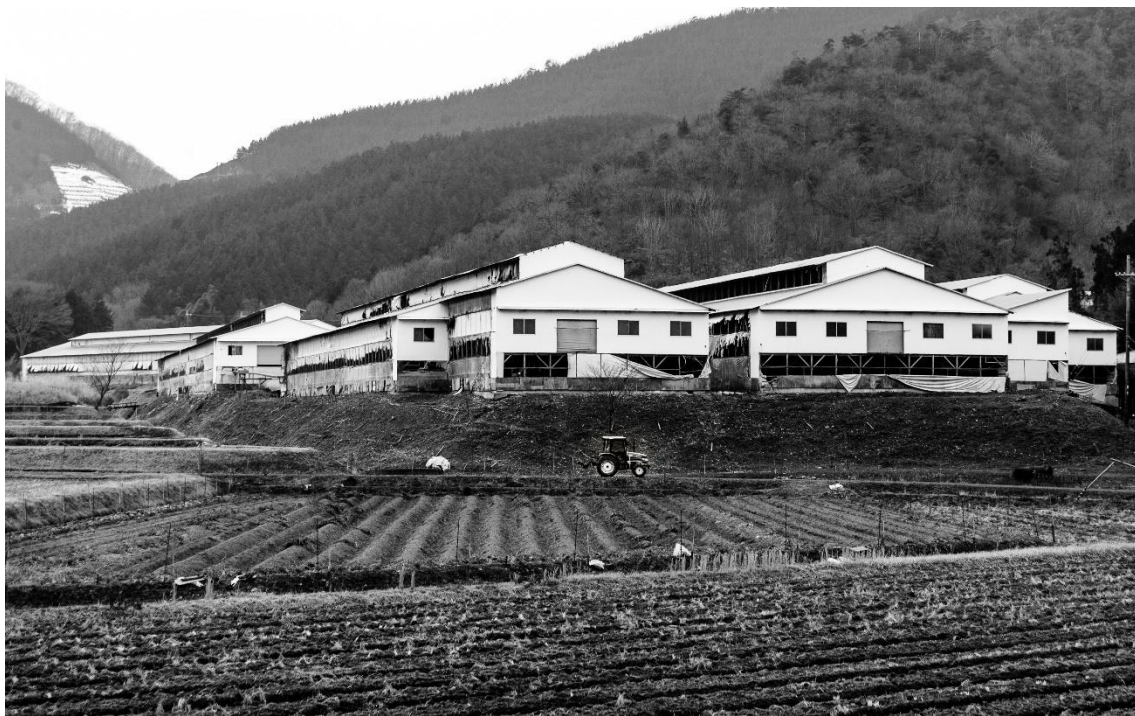
正面入り口方向から望む鶏舎群