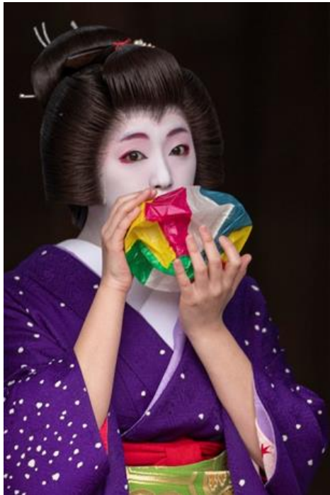
上 新春舞妓撮影会「紙風船」